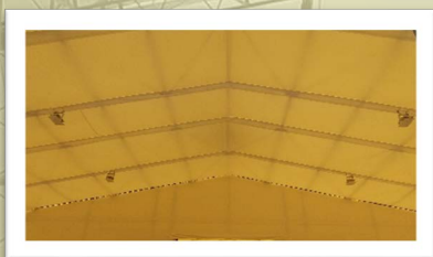
⑤ 内幕 ⑥ 照明